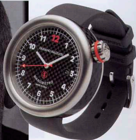
Colecção Manómetro S, em titânio e fibra de carbono, em ouro polido e fibra de carbono e em ouro escovado e fibra de carbono