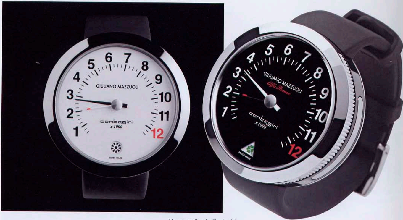
Duas versões do Contagiri