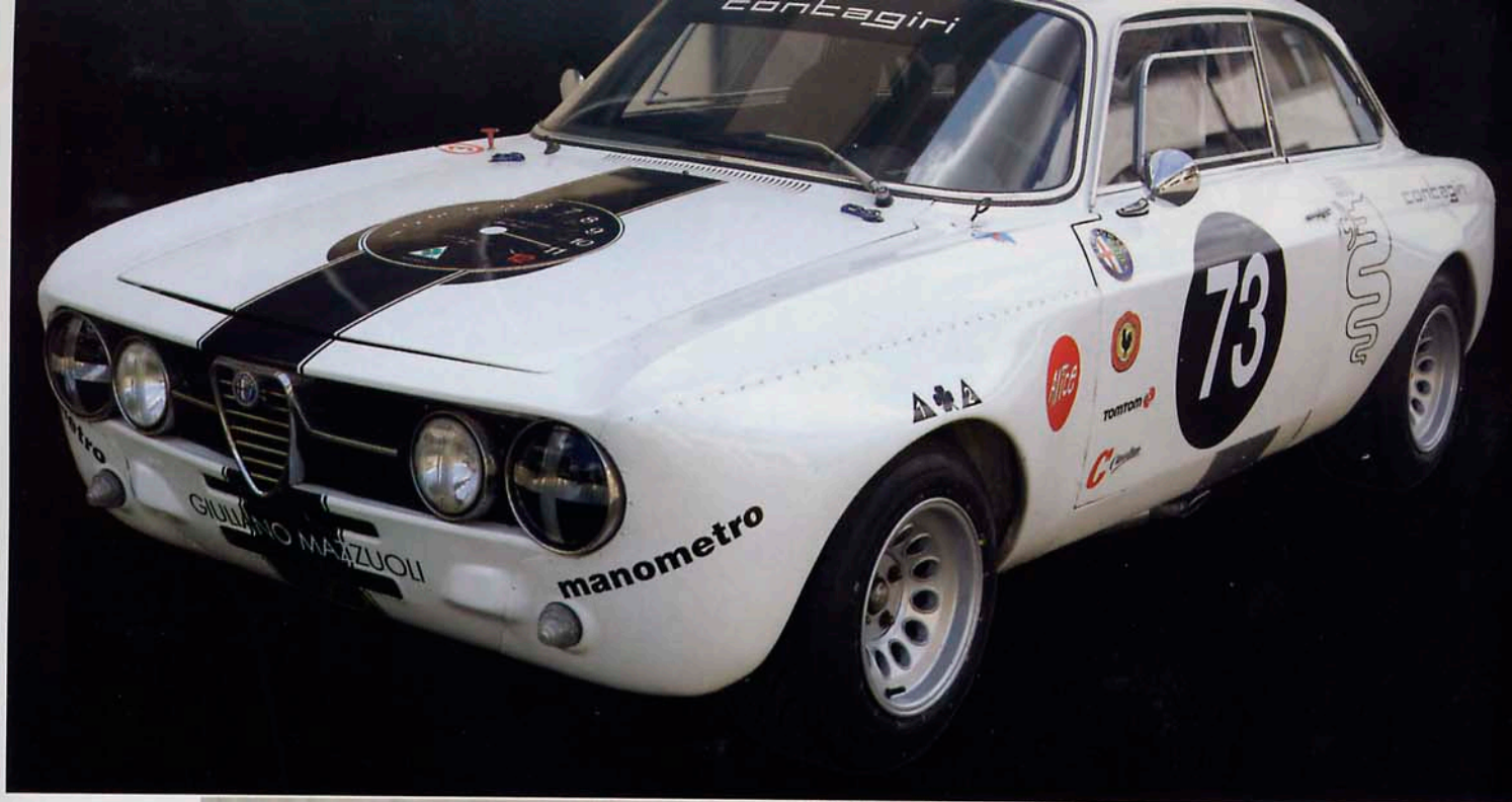
Nella foto a destra, Paul Newman, attore statunitense grande appassionato di motori, insieme a Giuliano Mazzuoli. Sopra, l'Alfa GTAm di proprietà di Mazzuoli.