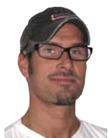
Af Kristian Haagen/Timegeeks.dk

Hagl, mudderfestival eller beach party? Den danske sommer bød som sædvanlig på alt mellem himmel og jord. Design Ure og Smykker har samlet nogle ure, der med sikkerhed passer til enhver lejlighed lige meget, hvilken vej vinden blæser.