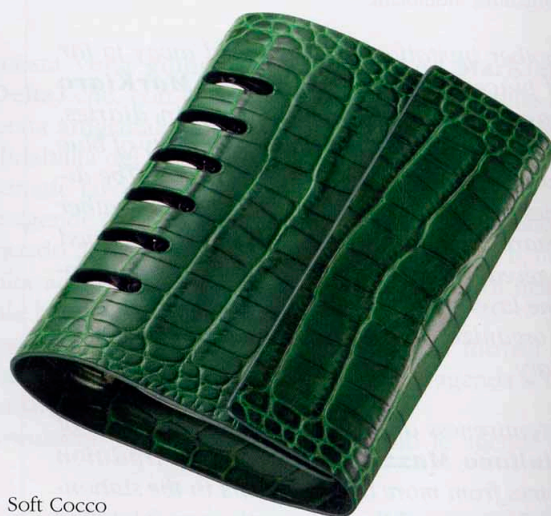
Soft Cocco di Nava Design