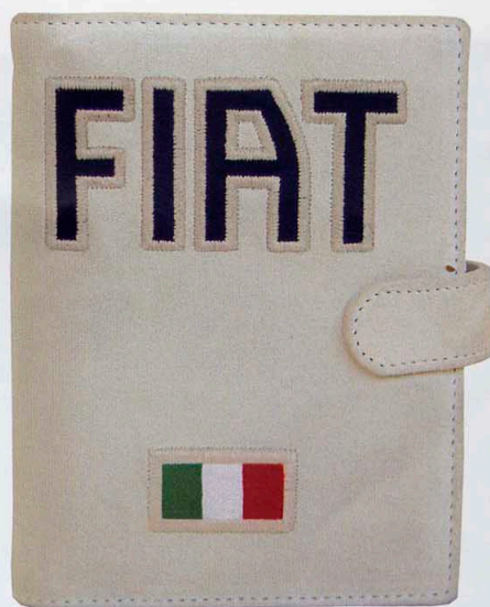
Agenda Fiat di Giuliano Mazzuoli